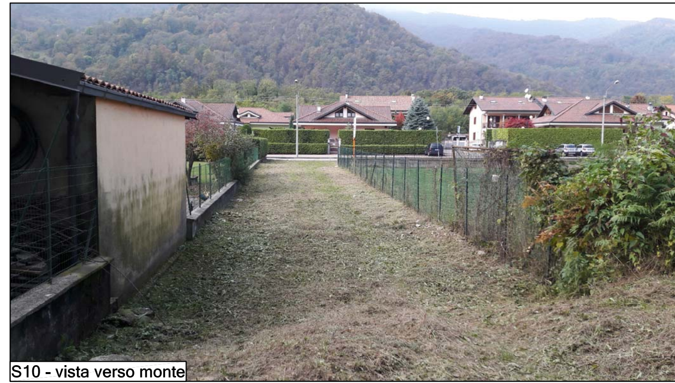
S10 - vista verso monte