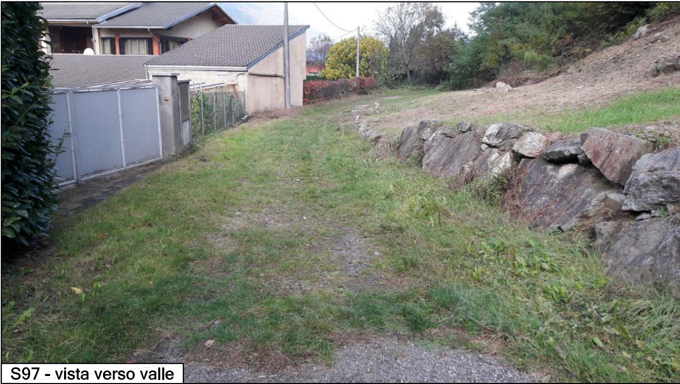
S97 - vista verso valle