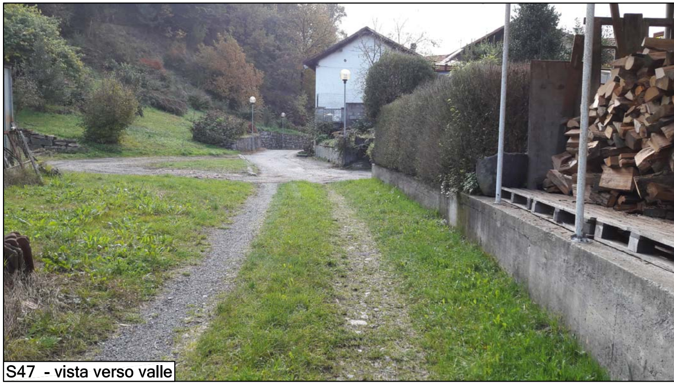
S47 - vista verso valle