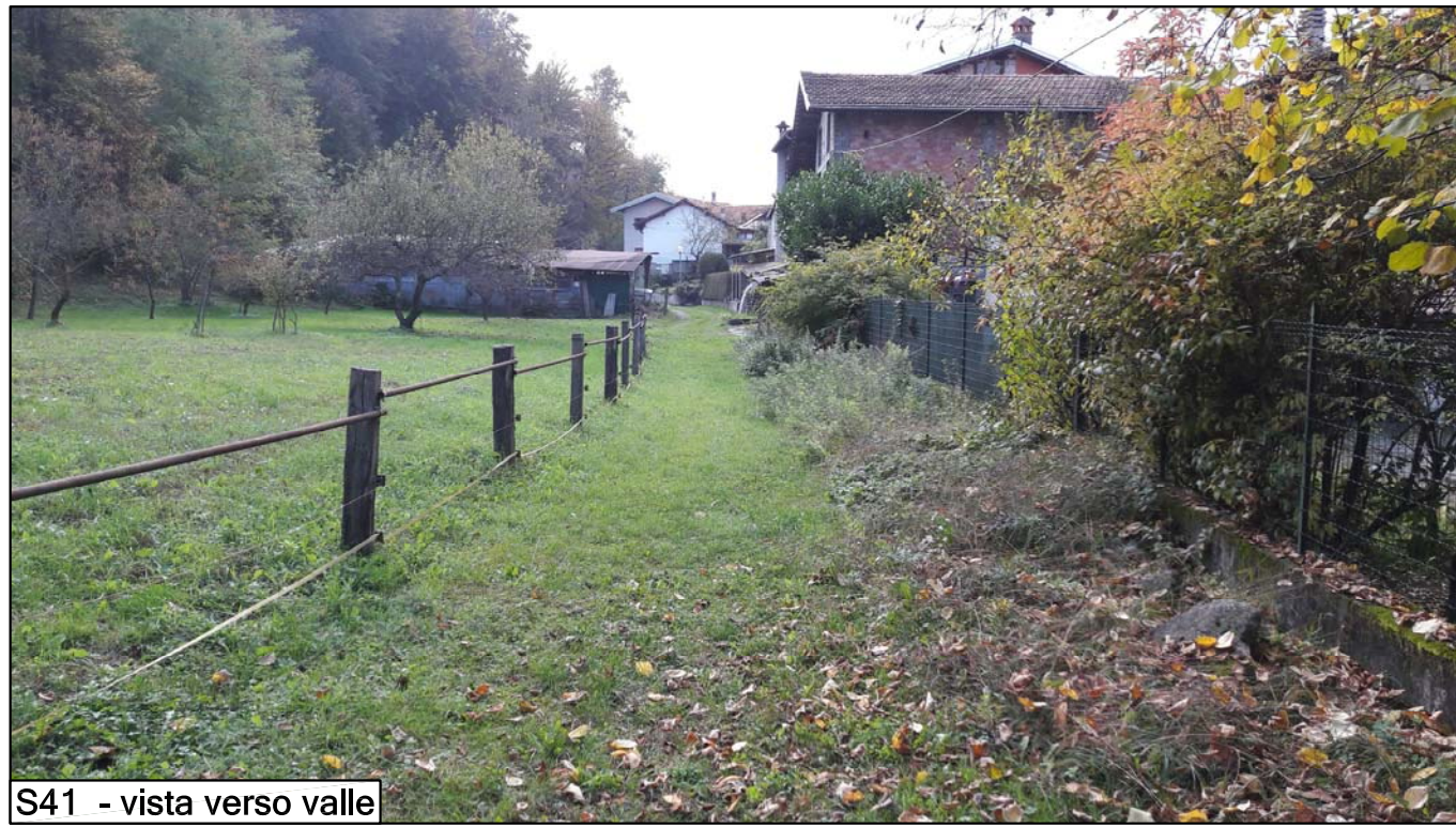
S41 - vista verso valle