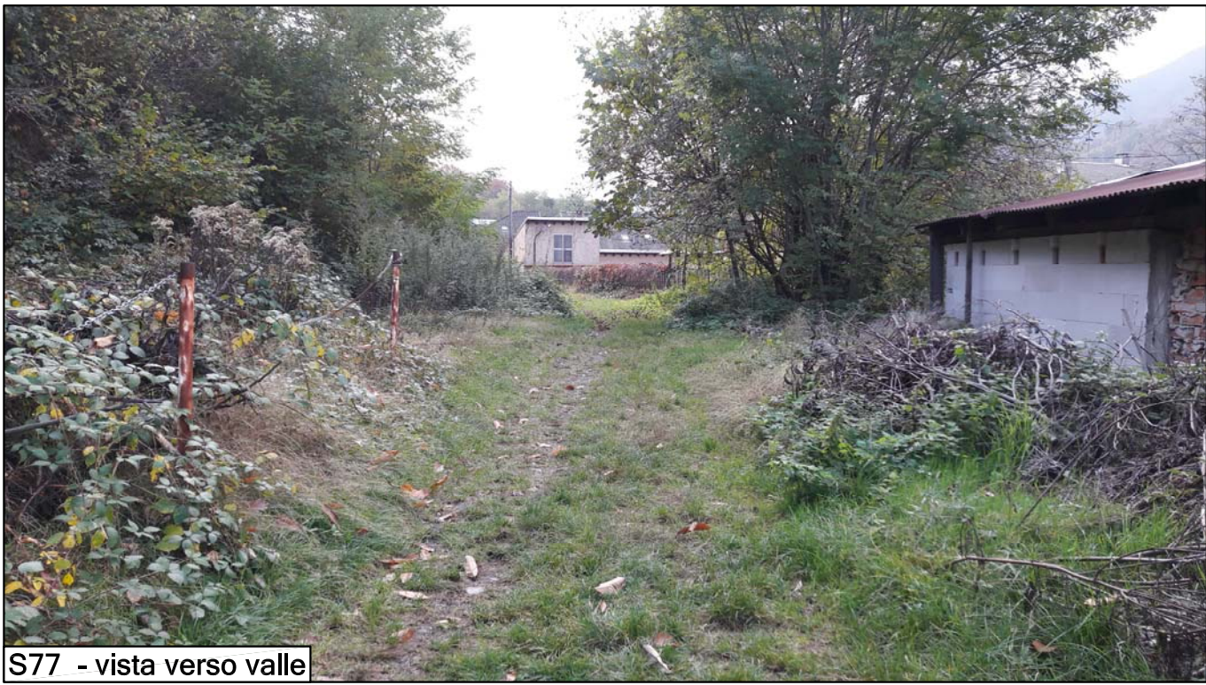
S77 - vista verso valle