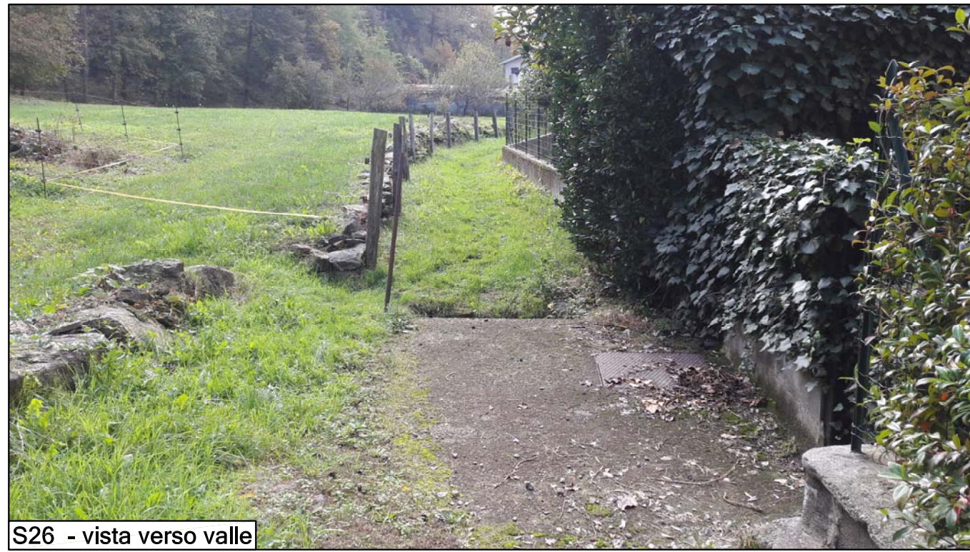
S26 - vista verso valle