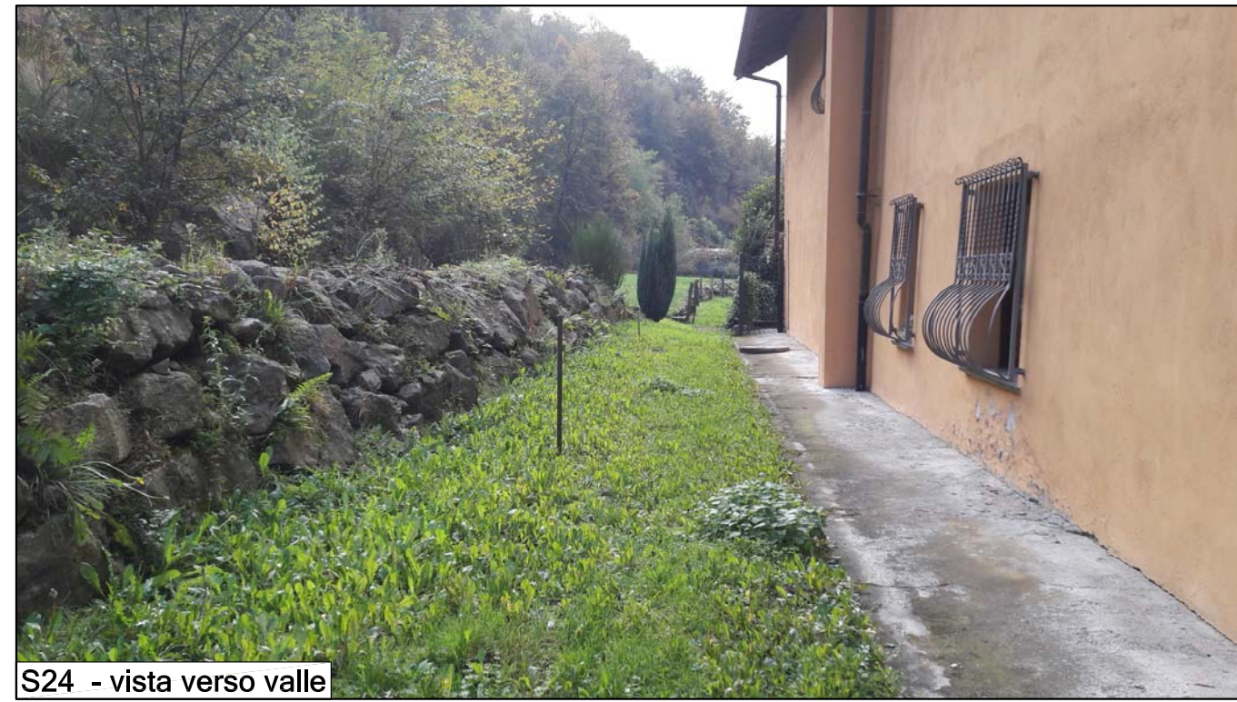
S24 - vista verso valle