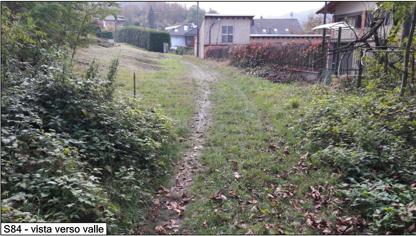
S84 - vista verso valle