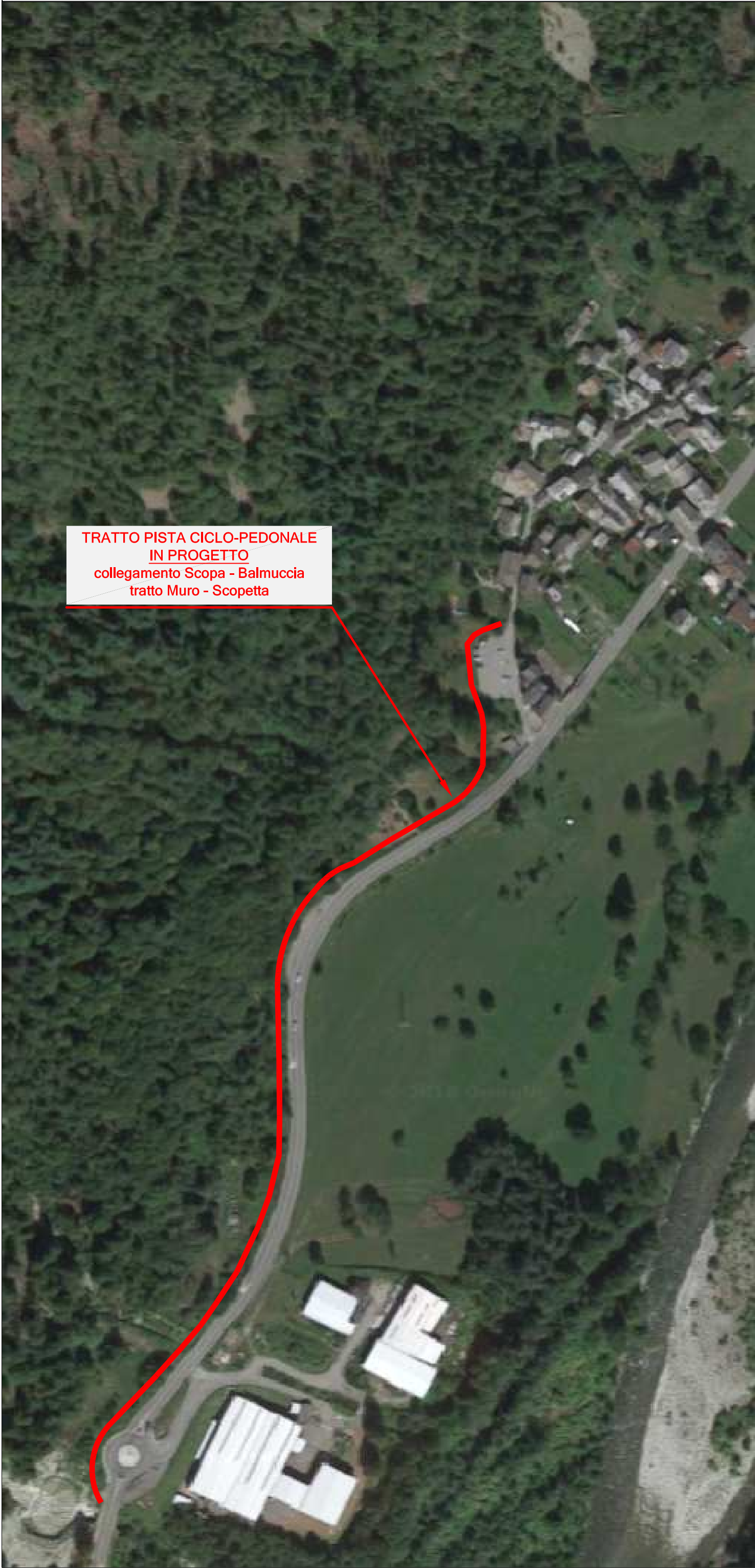
ESTRATTO VISTA AEREA TRATTO DI INTERVENTO

TRATTO PISTA CICLO-PEDONALE IN PROGETTO collegamento Scopa - Balmuccia tratto Muro - Scopetta